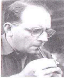
professor, escritor, pintor